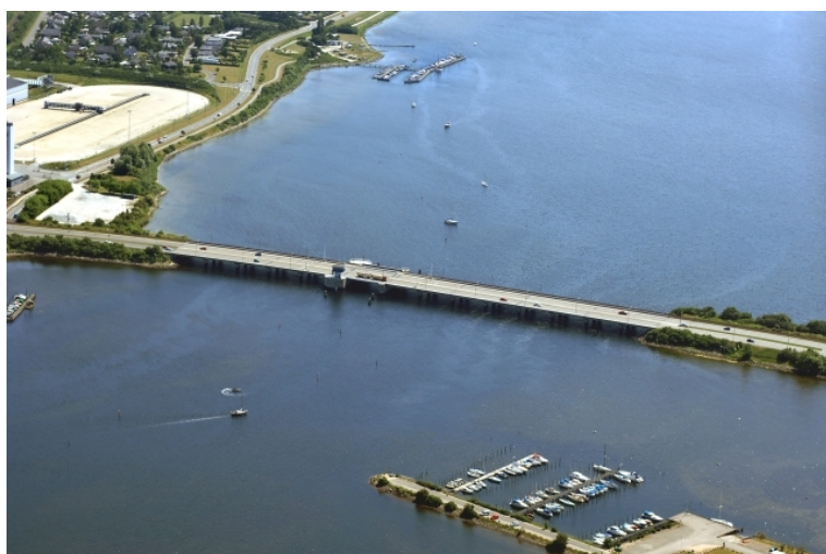
Set fra N - fotograferet juli 2006