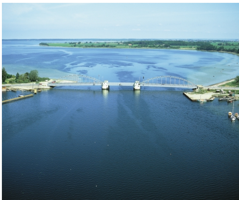
Set fra S - fotograferet 1997

Overtrædelse af disse bestemmelser straffes med bøde.