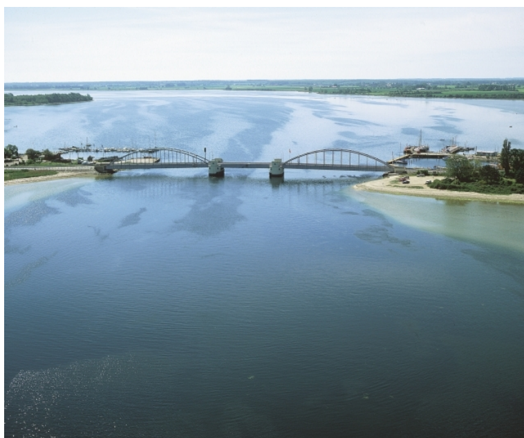
Set fra N - fotograferet 1997