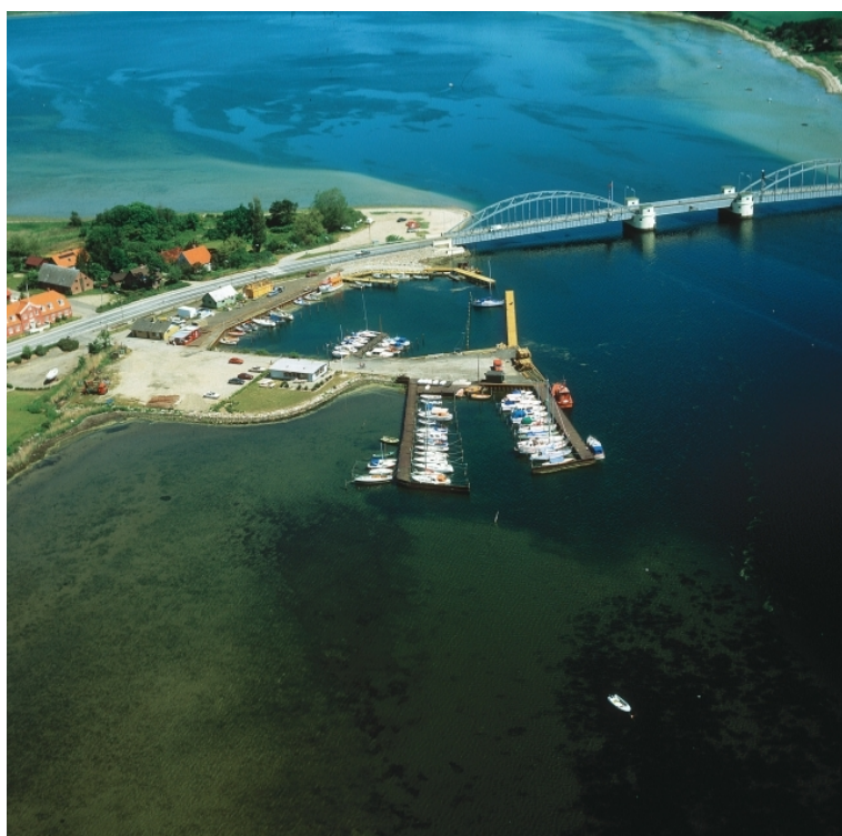
fotograferet maj 1997

Smålandsfarvandet, Guldborg Sund, Lolland E-kyst 54°52,2'N 11°44,8'E - kort 163